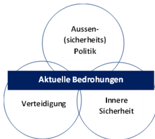
Figur 2: Einbettung der Kooperationsmöglichkeiten in eine umfassende und vernetzte Sicherheitspolitik

Die Einbettung und Steuerung der erweiterten Kooperationsmöglichkeiten sind eine Aufgabe der Sicherheitspolitik, die über die Sicherheitspolitischen Berichte gesteuert wird. Eine übergeordnete Gesamtsicht ist allein schon daher entscheidend, weil die bilaterale und die multilaterale Kooperation in der Praxis ineinander übergehen (siehe Empfehlung 5). Während die Impulse für gemeinsame Aktivitäten im Bereich der bilateralen Kooperation oftmals von unten (Fachebene) nach oben (sicherheitspolitische Ebene) fließen, müssen die Kooperationsimpulse im multilateralen Bereich primär von der strategisch-politischen Ebene kommen. Von besonderer Bedeutung sind dabei die Festlegung der übergeordneten inhaltlichen Schwerpunkte sowie die Steuerung der internationalen Kooperation mit Blick auf Koordination, Zielkonflikte und Grenzen.