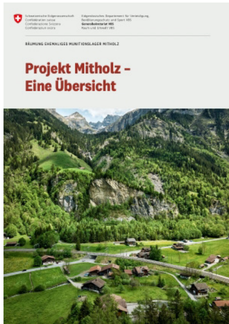
80 086 12 Projekt Mitholz_Eine Uebersicht

Unter der Vorschau finden Sie den Link zum Online Dokument.