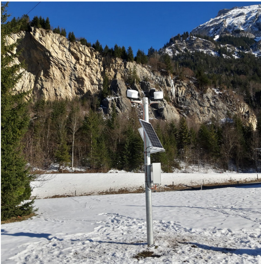
Installationen der Kameras für die Mono-Photogrammetrie im Februar 2023

Die Messstation wird mit einer Solarstrom betrieben. Sie übermittelt die Bilder an einen Server zur digitalen Auswertung und Darstellung der Ergebnisse im Cockpit des Mess- und Alarmierungssystems.