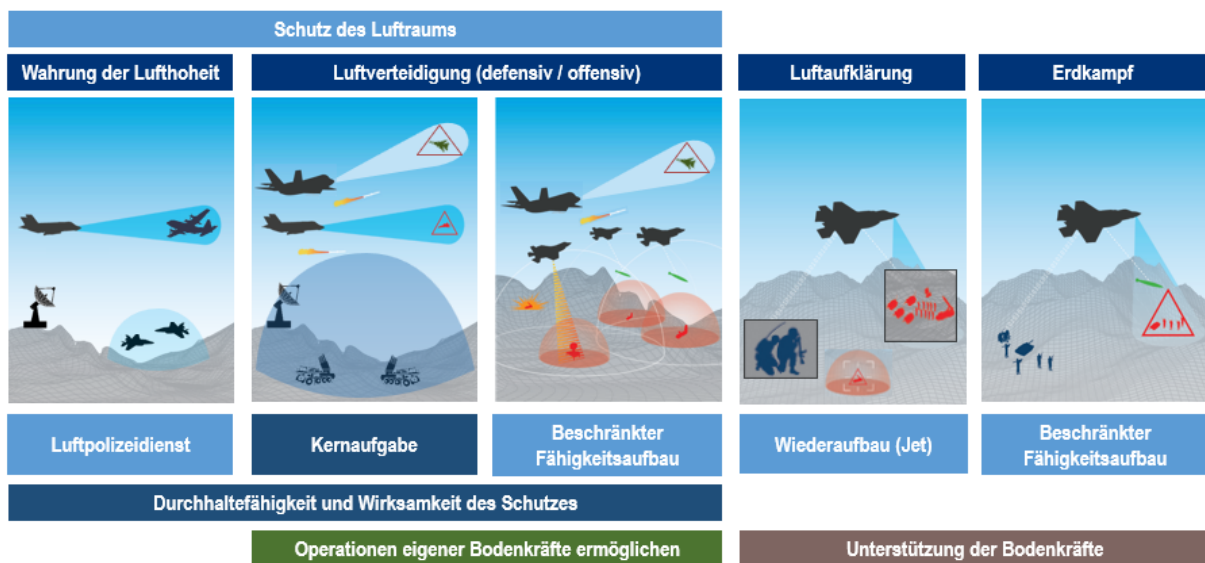
Abbildung 2: Einsatzspektrum der Luftwaffe

Da sich die Phasen der Bedrohung – normale Lage, erhöhte Spannungen und bewaffneter Konflikt – immer weniger voneinander trennen lassen, müssen die Mittel der Luftverteidigung bereits im Alltag einsatzbereit sein. Heute steht nicht mehr der Luftpolizeidienst im Vordergrund, sondern die frühzeitige Erkennung und Bekämpfung komplexer Bedrohungen. Schnelle Reaktionszeiten sind dabei entscheidend. Seit 2021 hält die Schweizer Luftwaffe rund um die Uhr zwei bewaffnete Kampfflugzeuge für Interventionen im Rahmen des Luftpolizeidienstes bereit. Angesichts der kurzen Vorwarnzeiten bei Bedrohungen aus der Distanz dürfte diese Einsatzbereitschaft künftig jedoch nicht mehr ausreichen, sondern müsste