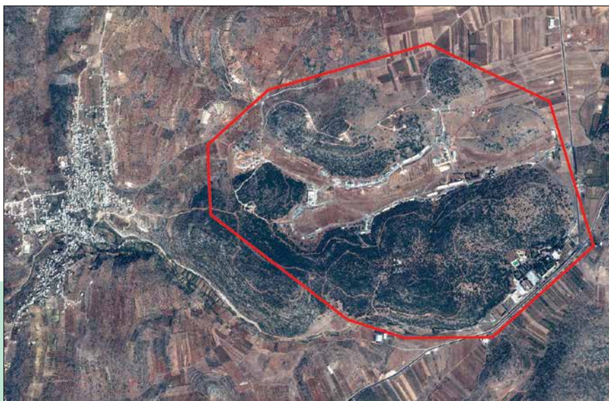
A sinistra: presunta installazione di armi chimiche del Scientific Studies Research Center in Siria bombardata da Israele il 7 settembre 2017 (ripresa PLE del 24 settembre 2017)

La lotta contro la proliferazione è compito della comunità internazionale. La Risoluzione 1540 del Consiglio di sicurezza delle Nazioni Unite, adottata all'unanimità il 28 aprile 2004, invita gli Stati membri a «adottare e applicare misure efficaci per istituire controlli interni volti a prevenire la proliferazione di armi nucleari, chimiche o biologiche e dei loro vettori, anche introducendo controlli adeguati sui materiali connessi». A tal fine esistono sul piano internazionale quattro regimi di controllo delle esportazioni. Per quanto riguarda le armi chimiche e biologiche, sussistono inoltre convenzioni internazionali giuridicamente vincolanti, il cui scopo è la messa al bando mondiale di tali armi. La Svizzera è membro di tutti i regi-