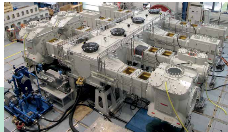
Immagine a destra: secondo alcune informazioni, compressori simili di produzione svizzera avrebbero dovuto essere utilizzati nell'ambito del programma di armi nucleari pakistano (fotografia privata)

Tale modo di procedere rende difficile alle aziende fornitrici il riconoscimento dell'utilizzazione effettiva del loro prodotto. Particolarmente problematici sono i beni a duplice impiego ( dual-use ), che ben si adattano ad applicazioni sia civili sia militari.